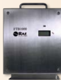
RAE PowerPak externe Batterie