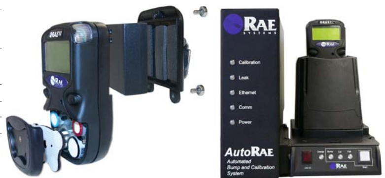
Der QRAE II mit optionaler AutoRAE Lade-, Bump Test- und Kalibrierstation